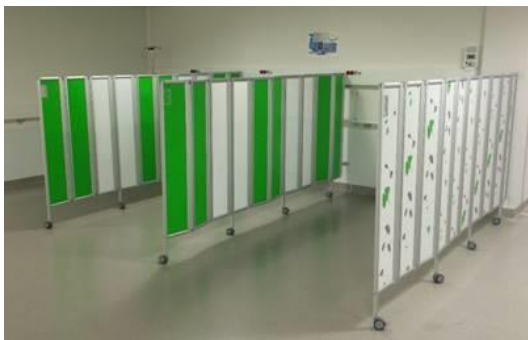
Sliki sta simbolični